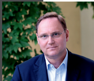
RA Michael Lennartz Kanzlei lennmed.de Rechtsanwälte Bonn / Berlin / Baden-Baden www.lennmed.de

Bedeutet Wachstum notwendig Effizienzverlust? Wie entstehen solche Verluste und wie können sie vermieden werden? Was heißt Effizienz im Alltag der zahnärztlichen Großpraxis und wie lässt sie sich messen und benchmarken?